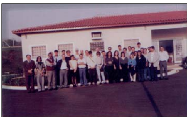
Visita Técnica à ETE Piracicamirim (Piracicaba – SP) ocorrida durante o 3º Encontro de Organismos de Bacias (Data de Fundação da REBOB – 1998).

Em 1997, após a promulgação da Lei nº 9433/97 (Política Nacional dos Recursos Hídricos) o Consórcio PCJ, em parceria com a Assemae, captou recursos do Fundo Nacional do Meio Ambiente e, com o apoio da Secretaria Nacional dos Recursos Hídricos, Consórcios Intermunicipais e Comitês de Bacias, realizou a divulgação da nova lei, em diversos estados brasileiros, em seminários com dois dias de duração, estendendo-se até o final de 1998, com o evento de fechamento em Brasília-DF.